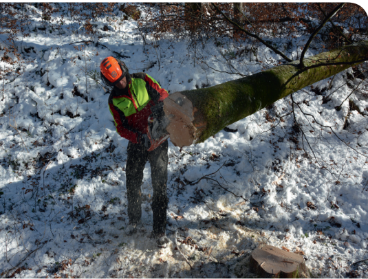
I lavori particolarmente pericolosi possono essere eseguiti solo se si può dimostrare la formazione.

I lavori connessi a pericoli particolari possono essere svolti soltanto da personale che ha conseguito con successo una formazione pertinente o può dimostrare le competenze conseguite. Ad esempio, per i lavori di raccolta del legname, è necessaria una formazione accreditata dalla Confederazione di almeno dieci giorni.