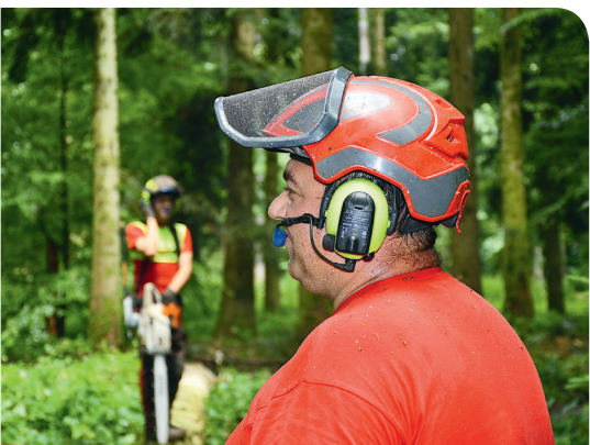
Può sempre succedere qualcosa - un incidente, una puntura d'insetto, un malore improvviso. Se si agisce rapidamente, si possono evitare gravi conseguenze. Perciò: mai lavorare da soli nel bosco!

Gli apprendisti in un rapporto di apprendistato agricolo possono svolgere i corsi di raccolta legname dall'età di 15 anni.