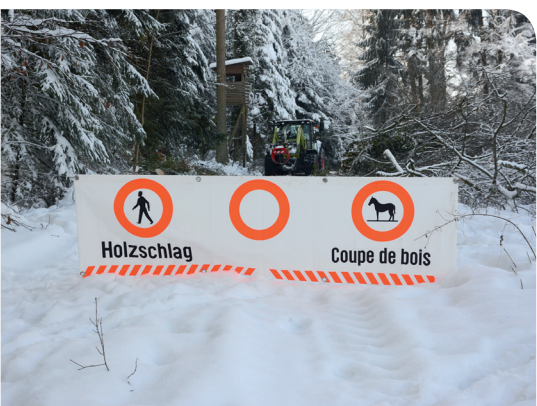
I terzi non devono essere messi in pericolo. Il taglio del legname deve essere segnalato e impedito l'accesso al cantiere, al meglio con altri aiutanti.