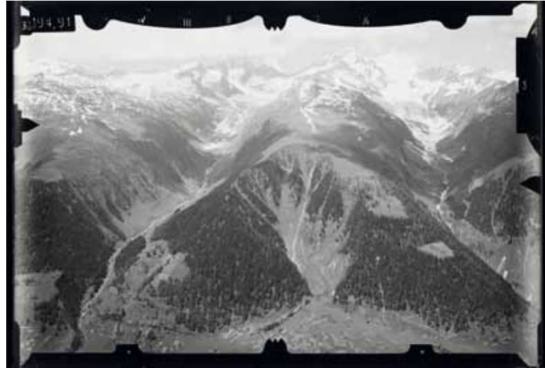
Zwei Schwarz-Weiss-Fotografien des Obergoms aus dem Jahre 1919

Im Zentrum steht das nachhaltige ökologische und ökonomische Handeln. Wir haben einen Zeithorizont von 25 Jahren im Auge, mögliche Schadenereignisse inbegriffen. Es stellt sich also immer wieder die Frage, wie viel Holz man sorgfältig und kostenbewusst herausnimmt, um den Jungwald zu fördern und die Biodiversität