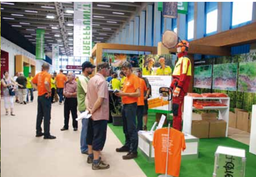
Bilder sind ein wichtiges Mittel, um die Aufmerksamkeit der Besucher zu gewinnen (Bild ganz links und Mitte)