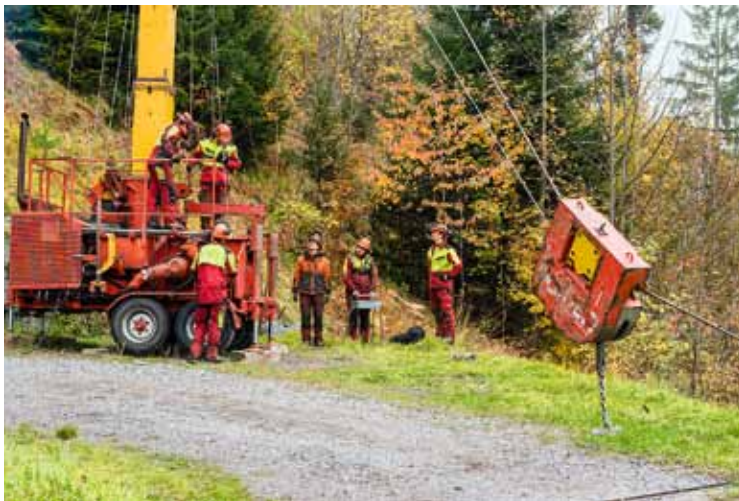
Für den Bergwald erfunden: Am Laufwagen (r.) des Seilkran werden die Stämme befestigt.