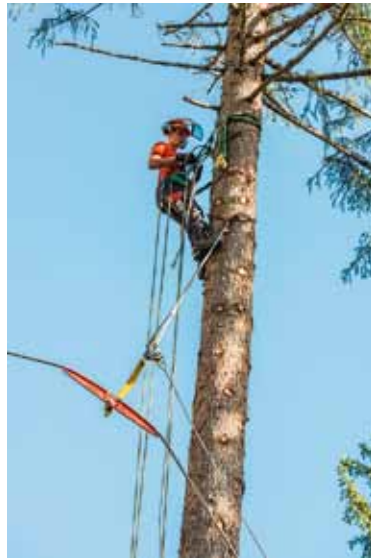
Demontage: Lehrling Martin Feusi holt das Seil in 20 Metern Höhe vom Baum.