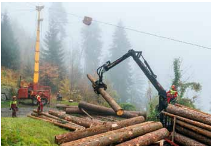
Als wären es Streichhölzer: Die Baumstämme werden am Sammelplatz auf einen Lastwagen verladen.