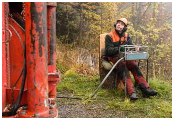
Am Steuerpult: Ein Forstwart-Lehrling bedient den Seilkran; dabei beobachtet er jede Bewegung in der Höhe genau.

1938 wurde die erste Anlage für den Verkauf produziert. Seither hat die Firma, die noch immer von der Familie Wyssen geführt wird, ihre Seilkräne stetig weiterentwickelt; das ursprüngliche Prinzip jedoch blieb dasselbe. Die Schweizer Erfindung kommt heute in über 60 Ländern rund um die Welt zum Einsatz.